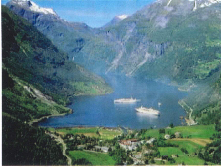
ガイランゲルフィヨルド (ノルウェー)

足柄上医師会ホームページを開設、内容の充実に努めてきました。その内容について発表し他の医師会の方々と意見を