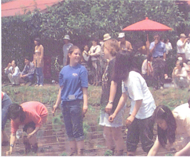
国際交流米づくり

(一) サラリーマン、公務員らの本人負担を二割から二割に (二) 高齢者(七十歳以上)