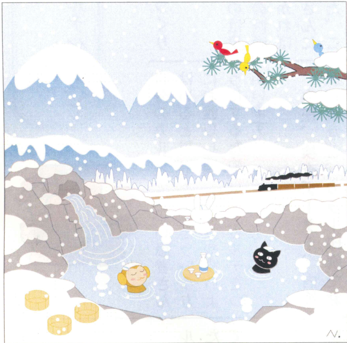
冬の温泉 （奥津直道画）