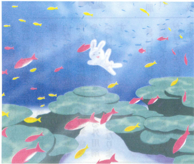
ダイビング (奥津直道画)

今後こういう場所への救急の 資材の備蓄を充実させるよう 話し合いが行われました。