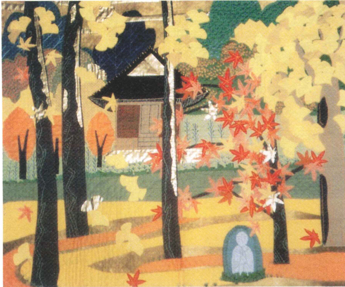
壁掛のしゅうしとアプリケーション 加藤良子作

足柄上地区に良好な医療、福祉を提供しようという目的に沿った事業展開が行われています。