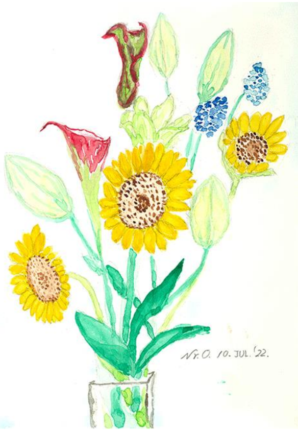
初夏の花 奥津 紀一

接種後の副反応は、これまで当院で実施した方の子からしますとこれまでの3回の接種とあまり変わりはないようです。 希望の方は、早めに接種券をもらってお申込み下さい。