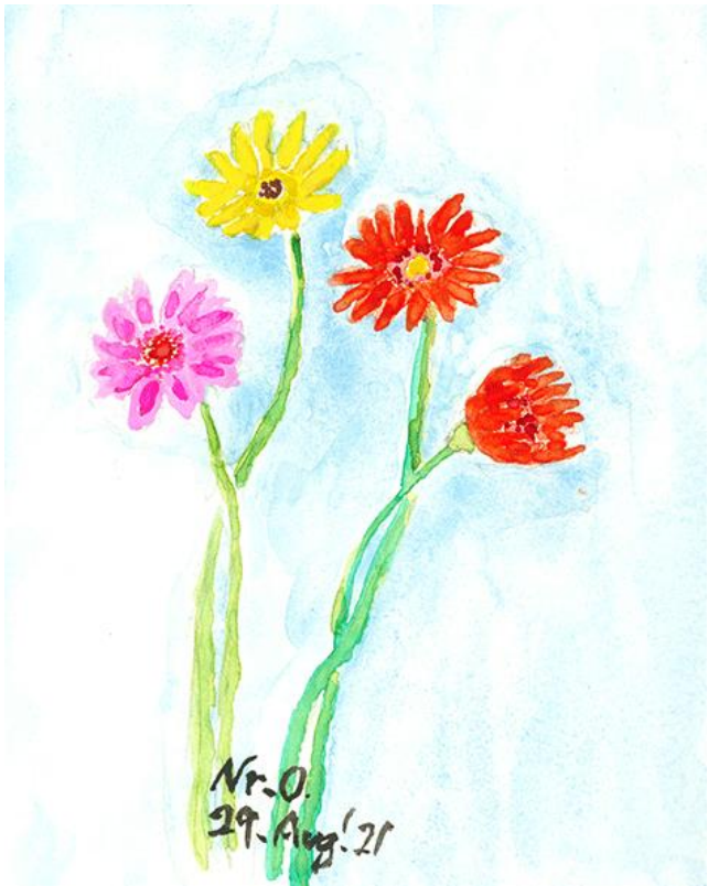
ガーベラ 奥津 紀一

若年者では会社勤務の方や学生が多く、接種を受ける方ではなくその家族からの申込みが多く、また突然のキャンセル等もあり、受付業務が大変になって来ています。