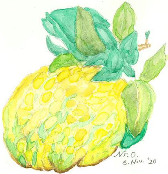
おにゆず 奥津 紀一