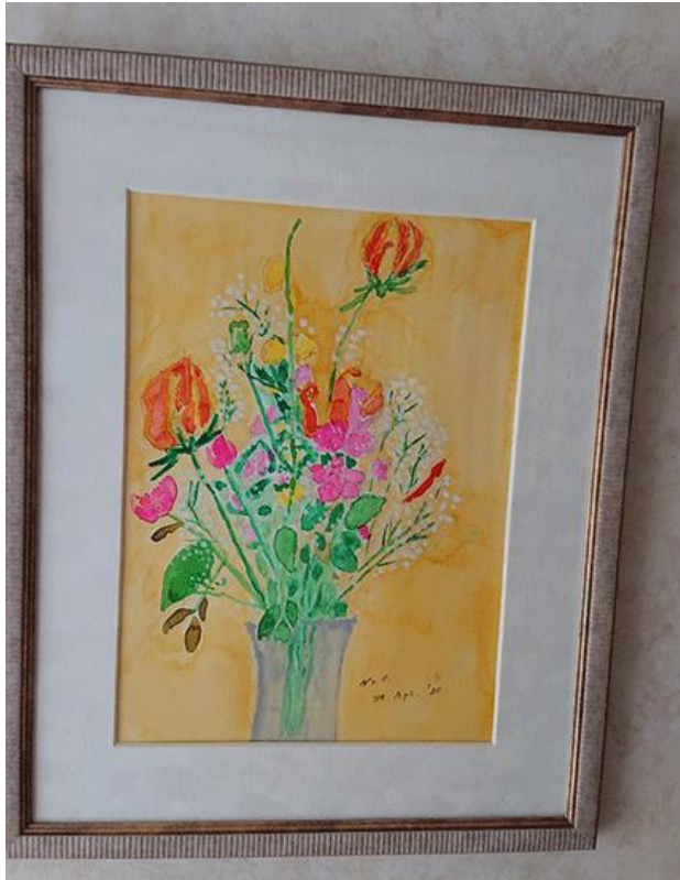
花束 奥津 紀一

緊急事態宣言が解除されて約1か月、まだ東京では100人、神奈川県で20人未満位のコロナウイルス陽性者が毎日出ています。これを0にすることはなかなか難しく私達としては、コロナウイルスと共存していく時代、ウイズコロナの時代を生きる事が求められています。予防接種ができるまでは仕方ないようです。しばらくは、マスク、手洗いに注意しながら生活しましょう。