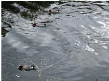
アネモネ 奥津 紀一