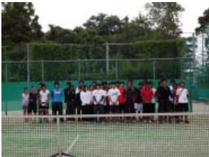
東邦大学 H24.9.8 習志野キャンパステニスコート 現役の学生

夜の学生との打ち上げの会ではその先輩は学生達とテニスのこと人生のことなど熱く語っていました。私にとっても夜遅くまで楽しい1日でした。