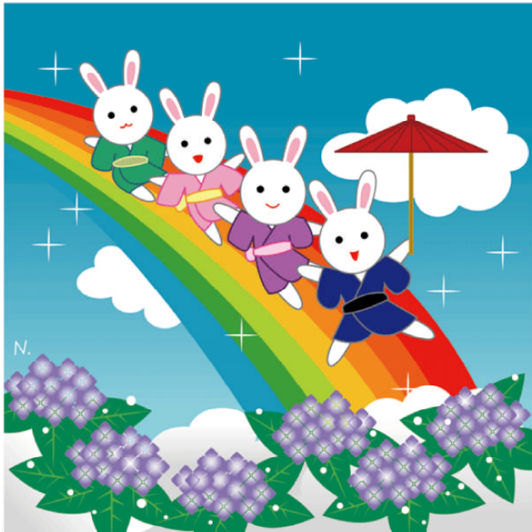
雨上がり 奥津直道 画